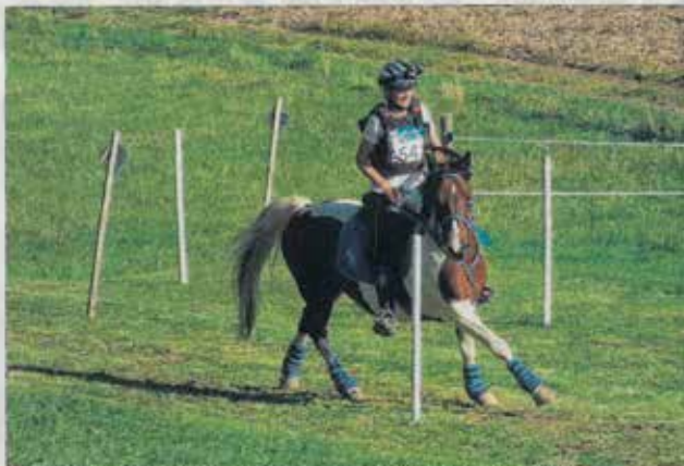
La maniabilité demande calme, franchise, obéissance et complicité entre cavalier et cheval.