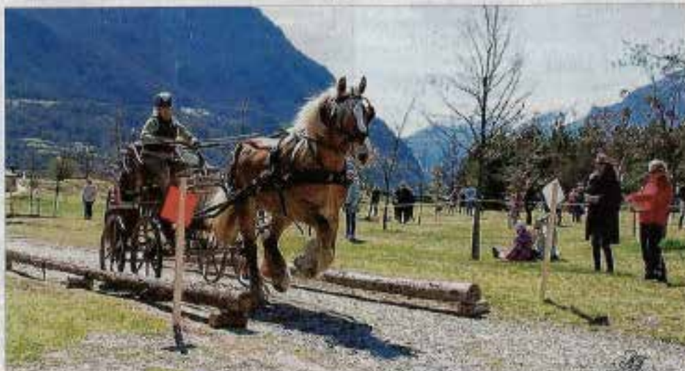
Sur le Trec de Mont-Dauphin, les attelages ont un côté magique et insolite. Sous un beau soleil, ils ont attiré les spectateurs.

Le parcours en terrain varié (PTV), lui, a attiré les spectateurs. Le long du parcours, les bénévoles notent les épreuves : immobilité, reculer en main, montées et descentes d'un talus à la même allure, franchissement du trec et fossé, slalom, passages de branches basses ou hautes, boudons maraichés... Le mouvement du che-