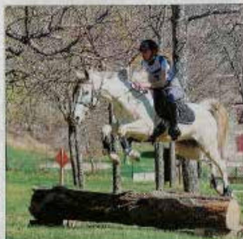
Le long du parcours en terrain varié, les franchissements de trecs et de fossés étaient impressionnants.