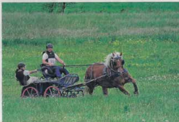
Les épreuves en attelages sont spectaculaires.