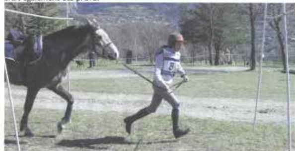
Passage à pied des « branches basses »

La Technique de Randonnée Équestre de Compétition se divise entre cavaliers seuls et attelages. Le T.R.E.C. et le T.R.E.C. attelé autorisent des épreuves en équipe accessibles aux groupes de 3 ou 4 cavaliers. 30 cavaliers et 4 attelages se sont illustrés sur 2 types d'épreuves techniques, qualificatives pour le championnat de France, le Parcours d'Orientation et de Régularité, de 10 à 20 km selon les catégories, et le Parcours de Terrain Varié, sur moins de 2 km, rassemblant des difficultés diverses. Un parcours de découverte spécial à l'attention des plus jeunes avait également été prévu.