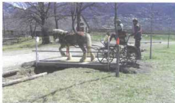
Catégorie « attelage » passage du pont

Après les heures de la matinée consacrées dimanche au POR (cinq parcours différents) avec des points de contrôle (balises à poinçonner), les cavaliers et les attelages ont été chronométrés l'après-midi sur le PTV, constitué d'une succession de difficultés et d'obstacles (12 pour le « club 1 », 14 pour le « club élite »