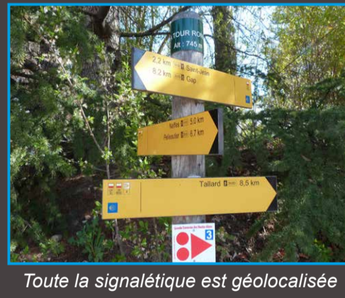
Toute la signalétique est géolocalisée

Concrètement, la saisie se réalise sur Geotrek-admin, module dédié à la gestion des données. Sur ce support, une partie des éléments inscrits sont publiés à destination du grand public et sont visibles directement en ligne dès le lendemain sur la plate-forme grand public Geotrek-rando.