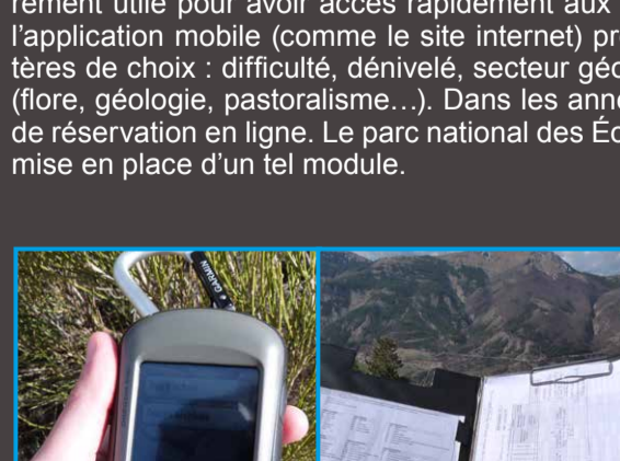
La collecte est organisée avec une grille de référencement

Une autre fonctionnalité intéressante de Geotrek est son application mobile. Véritable outil de valorisation des itinéraires de randonnée, l'application est utilisable d'un smartphone ou une tablette. Elle est particulièrement utile pour avoir accès rapidement aux points d'intérêt touristique géolocalisés sur les sentiers. De plus, l'application mobile (comme le site internet) propose aux visiteurs de rechercher leur itinéraire selon divers critères de choix : difficulté, dénivelé, secteur géographique, temps de parcours, ou encore selon des thématiques (flore, géologie, pastoralisme...). Dans les années à venir, on peut également imaginer le déploiement d'un outil de réservation en ligne. Le parc national des Écrins est d'ailleurs en train de travailler activement à une éventuelle mise en place d'un tel module.