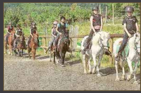
Photos tirées de l'article du Dauphiné du 5/06/2015 au Relais du Terrail