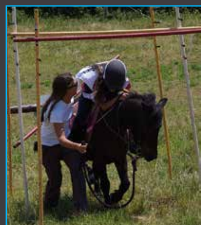
Une jeune cavalière aux branches basses sur le PTV

Une idée rando, un stage? N'hésitez pas à nous envoyer un message! Retrouvez toutes nos actus sur le site internet du CDTE rubrique « Calendrier »