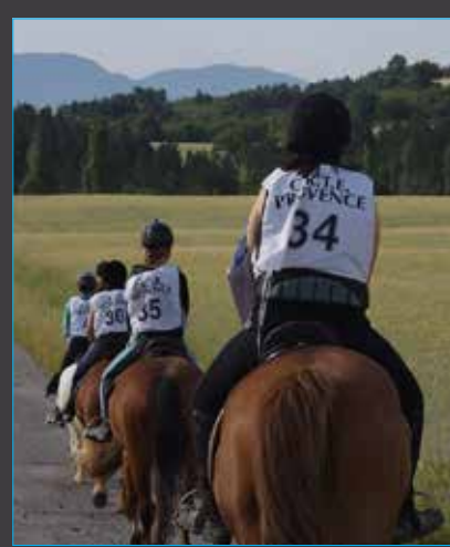
Une équipe de jeunes cavaliers sur le POR (J. Hervé)